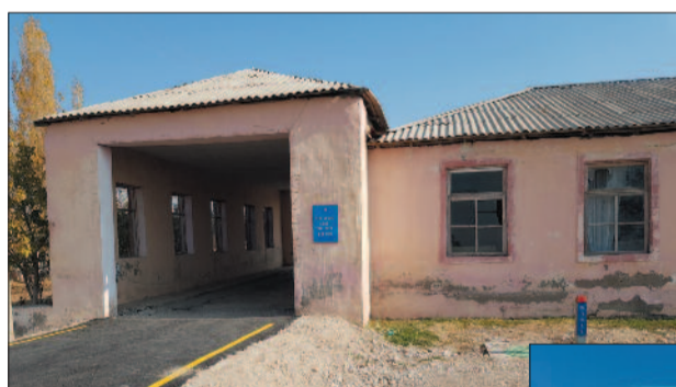
Yeni Havuş kəndindəki köhnə məktəb binası

yoxdur: müasir sinif otaqları, hərbi kabinə, tədris proqramına və dərs vəsaitlərinə uyğun avadanlıqları olan kimya-biologiya və fizika laboratoriyaları, şahmat və kompüter otaqları. Məktəbdə internet də var, 3 elektron lövhə quraşdırılıb. Şagirdlərə yalnız yaxşı oxumaq və vətənpərvər gənc kimi yetişmək qalır. Belə olacağına isə heç də şübhə yoxdur. Söhbətimdə onlarda olan Vətən sevgisini gördüm.