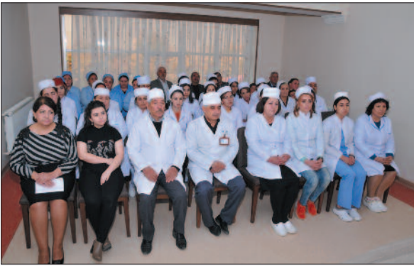
Dünən Ümumdünya Diabet Günü münasibətilə Kəngərli Rayon Mərkəzi Xəstəxanasında "Diabet məktəbi" adlı tədbir keçirilib.